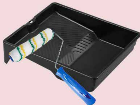
Rolo e Bandeja