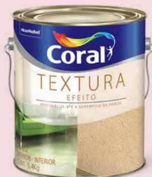
Coral Textura Efeito