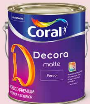
Coral Decora Matte